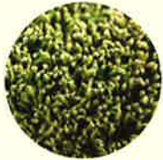
▲乾燥したコケ (葉を閉じ仮死状態)