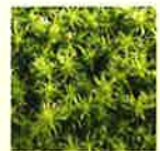
▲色とりどりのグラデーションが楽しめます。