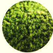
▲水分を含んだコケ (日光に当て成長を再開)